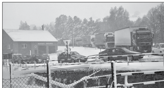
Sněhová kalamita - duben 2017