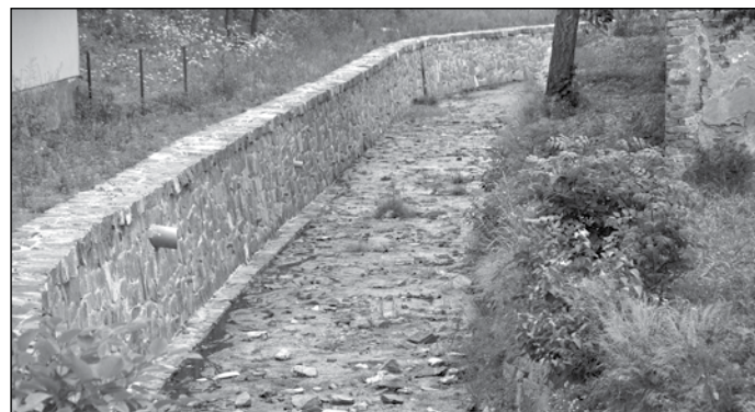
Koryto potoka Mušlov - červenec 2017

Uplynulé čtvrtletí zaznamenává i další extrém, ale tentokrát příjemný. A to je nejnižší míra nezaměstnanosti od roku 2009. Míra nezaměstnanosti dosáhla v naší obci v květnu 7,7 %, a na celém okrese Bruntál průměru 6,9 %. Bruntálsko je v rámci celé ČR po květnu 2017 uváděno jako 6 nejvyšší nezaměstnanost, naše obec však v rámci mikroregionu Albrechtice vykazuje nejvyšší nezaměstnanost a to oproti ostatním obcím Albrechticka o 1 %. Dočítáme se, že firmy obtížně hledají zaměstnance a je spousta volných pracovních míst. Jedná se zejména o manipulační dělníky a absolventy učňovských oborů. Za těmito zaměstnavateli je však nutno dojíždět do Krnova, Bruntálu nebo Opavy, tedy měst, kde se ožívují průmyslové zóny. Před rokem 1989 bylo dojíždění za prací na větší vzdálenost zejména pro mužskou populaci běžné. Jestli se tento trend podaří za exis-