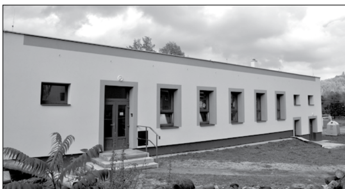
Budova školní družiny pro rok 2016/2017.

Ukončení první etapy reorganizace školství (přestěhování školky) proběhne do konce roku 2016. První etapa se netýkala pouze vybudování prostorů pro školku, aby byly zmodernizovány také třídy ZŠ (všechny třídy byly vybaveny novými vestavěnými skříněmi, některé částečně prosklené), a nové prostory školní družiny byly vybaveny také novým nábytkem.