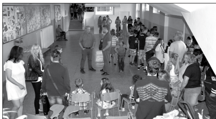
Zabavení školního roku 2016/2017.