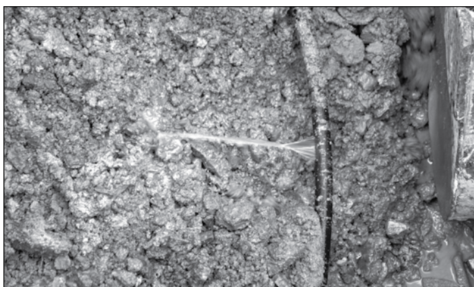
Prasklá vodovodní přípojka .

fundu oprav. Vodné se u nás zvyšovalo naposledy v roce 2011. Zastupitelstvo obce udělalo první krok, přistoupilo po čase k prvnímu mírnému zvýšení vodného a přijalo usnesení o zvýšení ceny vodného na cenu 25 Kč bez DPH od 1. 10. 2016. Toto zvýšení vodného nepřinese obci závatné peníze, neboť se jedná o částku cca 70 tis. Kč/rok. Obec se tedy bude i nadále podílet na spolufinancování vodního hospodářství v obci. Pro rok 2017 připravuje obec projekt na monitoring řádu. Za tímto účelem již 3 měsíce obec spolupracuje v oblasti vodního hospodářství se Službami města Albrechtic a s VAK Bruntál při hledání neoptimálnějšího řešení pro náš vodovodní řád. Detailněji se k závěrům tohoto projektu vrátíme v březnovém vydání Zpravodaje 2017.