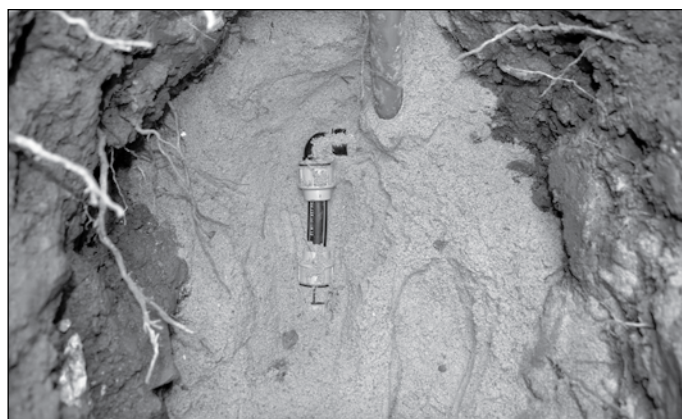
Opravená vodovodní přípojka .