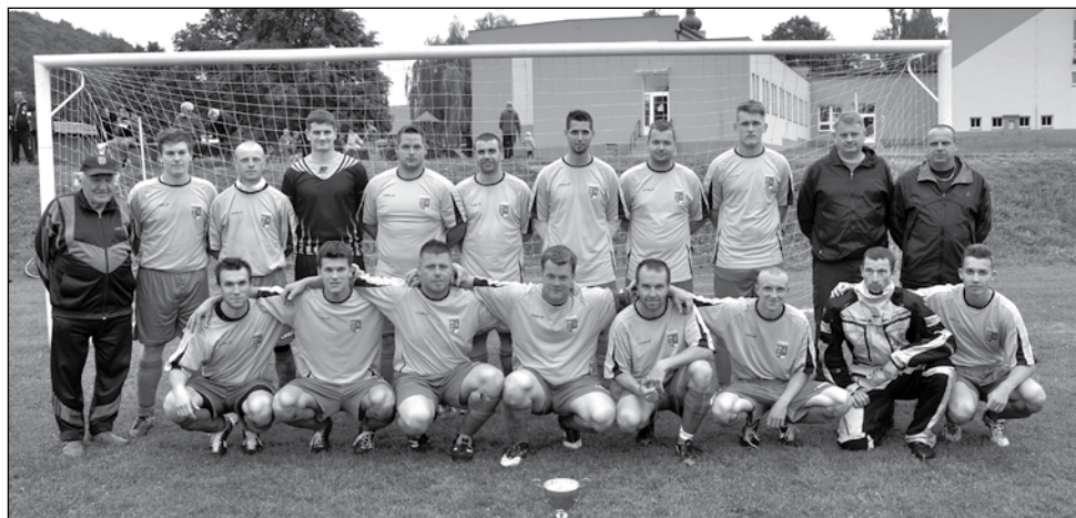
Mužstvo mužů - sezóna 2015–2016

Hurá, hurá hurá. Naši fotbalisté v kategorii mužů udrželi první příčku, a navrací se tak do okresního přeboru. Jestli bude jejich setrvání v této vyšší soutěži dlouhodobější, nebo se bude svým dějem blížit populárnímu televiznímu seriálu se stejným názvem, se uvidí. Každopádně přejeme úspěšný start do nové soutěže. Žáci udrželi druhou příčku své kategorie až do konce sezóny a postarali se tak o velké překvapení pro své soupeře.