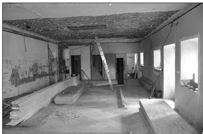
Komunitní turistické centrum – vestibul.