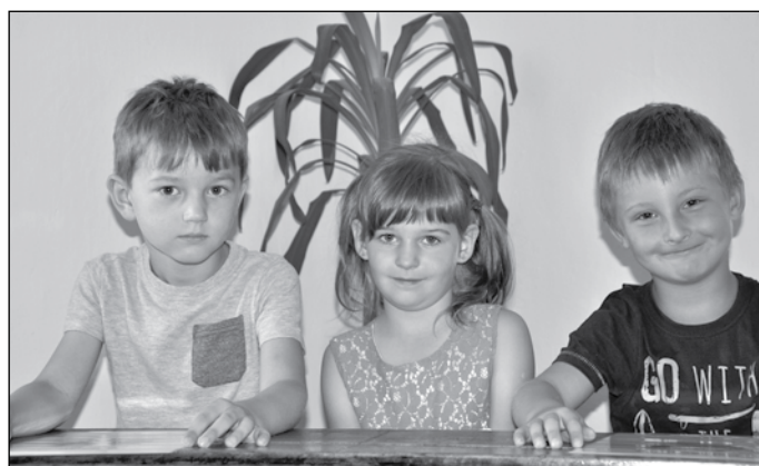
Předškoláci MŠ Třemešná.

(např. tělesná nebo výtvarná výchova). Stát poskytuje na dítě na I. stupni (1–5 třída) zřizovateli roční státní příspěvek na školu cca 28 000 Kč, na dítě na II. stupni (6–9 třída) poskytuje příspěvek 43 000 Kč/rok. Pravděpodobně nikdy nedá soud zřizovateli možnost, aby částku, o kterou jej rodiče dítěte obce umístěním svého dítěte do školy ve vedlejší obci, vymáhat po rodičích zpět. Důvodem nemožnosti je zrušení spádových oblastí a tím i řízeného rovnoměrného rozložení kapacity škol na základě počtu dětí v dané oblasti. Vše výše uvedené je důležité, aby měl každý možnost si uvědomit provázanost veškeré aktivity kolem naší školy, opodstatnění a nutnosti hledat neustále řešení, která obci jako zřizovateli umožní zachovat kvalitu školství v obci v takové míře, která bude odrážet potřeby a požadavky většiny občanů obce. V minulosti jsme vás prostřednictvím zpravodaje informovali o značném úsilí obce a finančních prostředcích, které