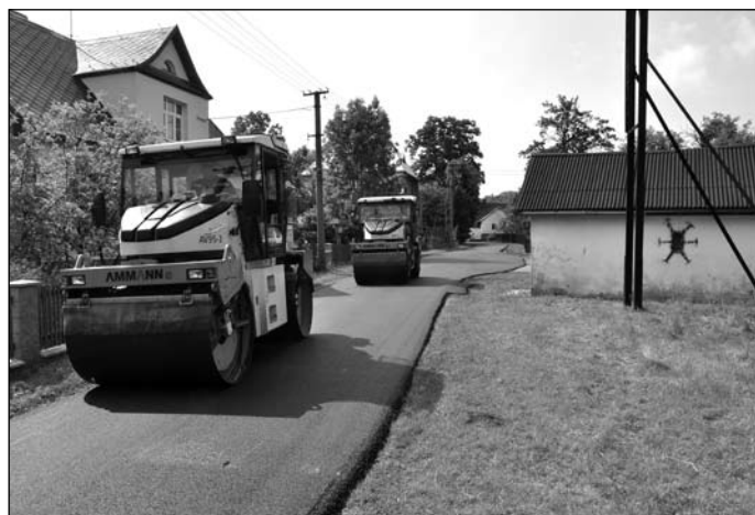
Oprava komunikace Damašek

Obec dokončuje opravu podkrovní části kulturního domu. K úspěšnému dokončení projektu se obci podařilo uspět s podanou žádostí na Moravskoslezském kraji v rámci programu Obnovy a podpory venkova. Tento projekt s názvem „Komunitní turistické centrum Třemešná-II etapa“ je podpořena z rozpočtu