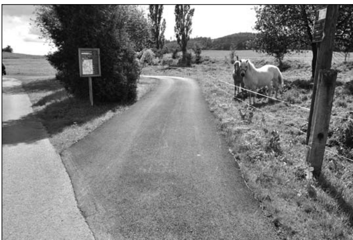
Oprava točny Nové Rudíkovy.

ně naplánované opravy o pár stovek metrů. Oprava povrchu se tak zastaví asi 200 m před hraniční cedulí naší obce. Při zmínce o opravách povrchu komunikací je vhodné uvést, že také naše obec každoročně investuje peníze do opravy povrchu místních komunikací. Letošní rok se zkompletovala oprava povrchu místní části komunikace Třemešná-Damašek, spojnice kolem kulturního domu a zhotovila se točna v části Nové Rudíkovy.