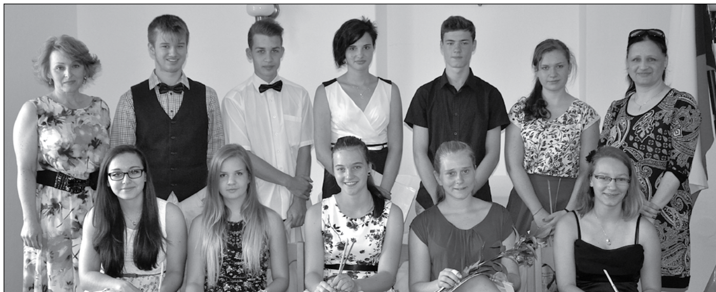
Rozloučení s žáky deváté třídy ZŠ na Obecním úřadě.

(např. tělesná nebo výtvarná výchova). Stát poskytuje na dítě na I. stupni (1–5 třída) zřizovateli roční státní příspěvek na školu cca 28 000 Kč, na dítě na II. stupni (6–9 třída) poskytuje příspěvek 43 000 Kč/rok. Pravděpodobně nikdy nedá soud zřizovateli možnost, aby částku, o kterou jej rodiče dítěte obce umístěním svého dítěte do školy ve vedlejší obci, vymáhat po rodičích zpět. Důvodem nemožnosti je zrušení spádových oblastí a tím i řízeného rovnoměrného rozložení kapacity škol na základě počtu dětí v dané oblasti. Vše výše uvedené je důležité, aby měl každý možnost si uvědomit provázanost veškeré aktivity kolem naší školy, opodstatnění a nutnosti hledat neustále řešení, která obci jako zřizovateli umožní zachovat kvalitu školství v obci v takové míře, která bude odrážet potřeby a požadavky většiny občanů obce. V minulosti jsme vás prostřednictvím zpravodaje informovali o značném úsilí obce a finančních prostředcích, které