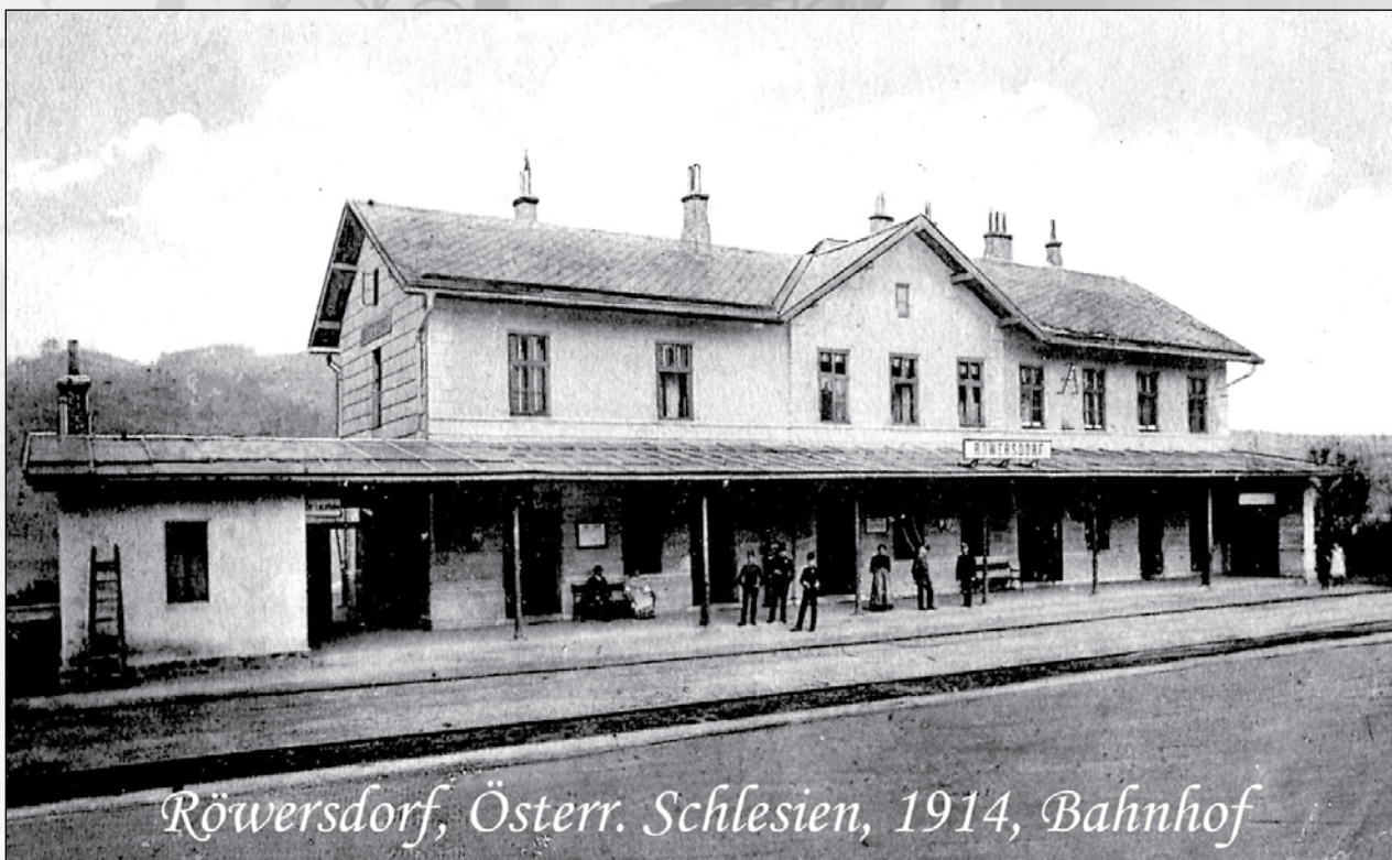
Röwersdorf, Österr. Schlesien, 1914, Bahnhof