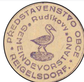
Historický znak Rudíkova

A tak prvním cílem spolku bude výstava fotografií, pohlednic a jiných předmětů týkajících se obce Třemešná, při níž bychom mohli získat informace o vzniku osady, povoláních a řemeslech původních obyvatel a očekává se případná beseda návštěvníky této výstavy na téma historie.