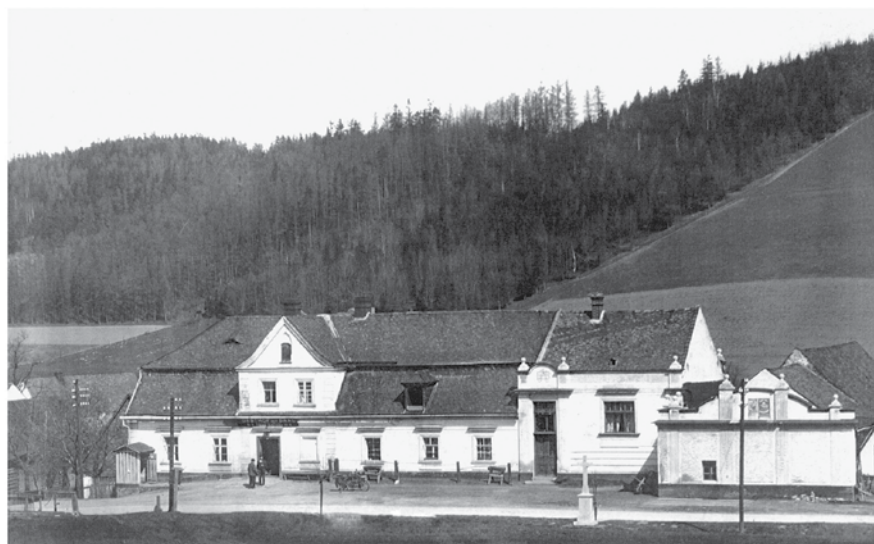
Röwersdorf, Schlesien, CSR, 1930 Gasthof Schwanké

lečného rozvoje důležitou stavbou v obci, neboť kromě ubytovací a hostinské činnosti zde bylo možnost objednat si služby i pohřební. Budova č. p. 14 byla také klíčovou zastávkou koňských dostavníků a formanů. Kdo má zájem o detailnější informace k domu č. p. 14 – např. o některých z majitelů, může navštívit web stránky www.vlastnirodokmen.webnode.cz a její záložku Ztracená Třemešná. Na uvedených web stránkách je možno získat také jiné praktické informace. Třeba pro budoucí osobní využití.